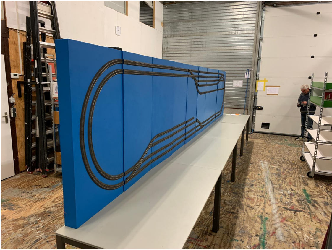
De Drierailbaan op zijn kant gezet