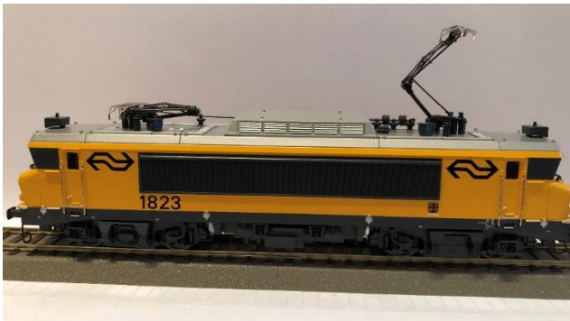
Roco 1823 Hilversum

Het Lima model (1605) is in de aflever uitvoering (Tyfoon onbeschermd en nummer in het midden). De Roco 1607, daar kon je kiezen uit drie nummers, 1607,1633,1655 met bijbehorend stadswapen, Vlissingen, Bergen op Zoom, Eindhoven; welke je er zelf op moest zetten vanaf een Decal (ik heb dus voor 1607 gekozen). (D.J.)