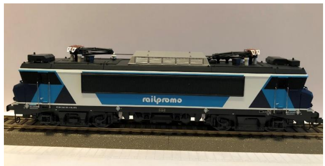
Roco Railpromo 101001