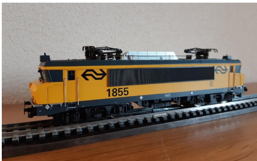
Model van Trix Express 1855

Zoals al uit de serienummering blijkt, zijn de 58 locomotieven opgesplitst. In 1999 werd de serie 1600 verdeeld in NS Reizigers (21 stuks) en NS Cargo (37 stuks). De locomotieven Cargo behielden hun nummers in de 1600 reeks, nl 1601-1637. De locomotieven van NS Reizigers werden omgenummerd in een 1800 serie met behoud van volgnummer en werden 1838-1858. In 2002 werden nog eens 14 locs overgeheveld van NS Cargo naar NS Reizigers, de locs 1623, 1624 en 1626-1637, deze gingen ook naar de 1800 nummering. Loc 1625 was te veel beschadigd en ging niet mee over.