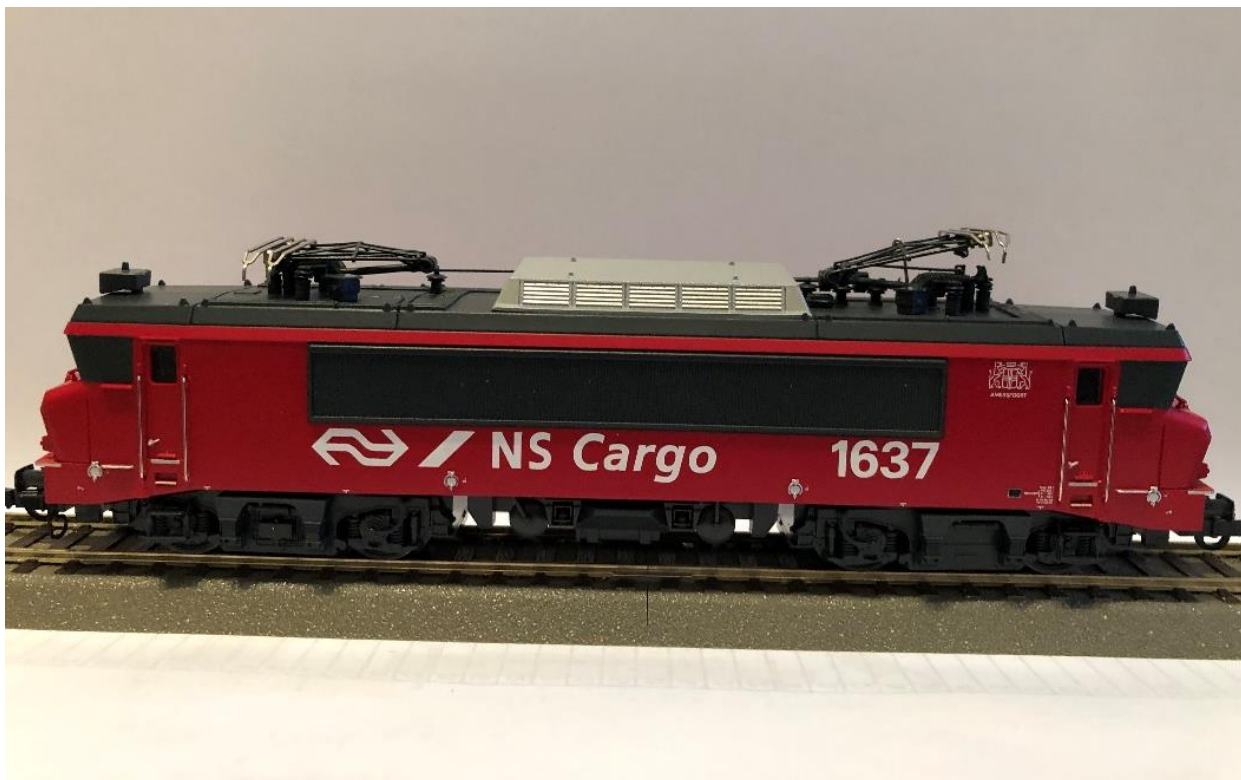
Roco NS Cargo 1637 Amersfoort

NS Cargo had dus vanaf 1999 de locs 1601-1637 in gebruik. Loc 1637 reed als enige in de rode kleur zijnde de huisstijl van NS Cargo. Later ging deze loc weer over naar NS Reizigers en werd weer geel. NS Cargo ging na een fusie met DB Cargo in 2000 verder onder de naam Railion en sinds 2009 onder de naam DB Schenker Rail . Per 1 april 2016 werd de naam weer veranderd in DB Cargo en reed voornamelijk met goederentreinen en enkele besloten reizigerstreinen. Vanaf 2009 werden geleidelijk aan de meeste locs gesloopt. Zeven locs kregen in 2012 de rode kleur. Deze locomotieven reden vanuit de Kijfhoek naar Amsterdam, Onnen bij Groningen, Sloe en Sittard. Per 3 april 2020 werden ook de laatste 3 locs buiten dienst gesteld.