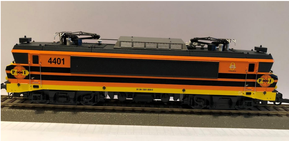
Roco RRF 4401

Rail Force One rijdt sinds 2017 als zelfstandig vervoerder in Nederland en heeft de locs 1828,1829 en 1831 overgenomen van het inmiddels failliete Locon. Zo zijn er nog meer overnames geweest , maar vanwege de onoverzichtelijkheid laat ik dit achterwege.