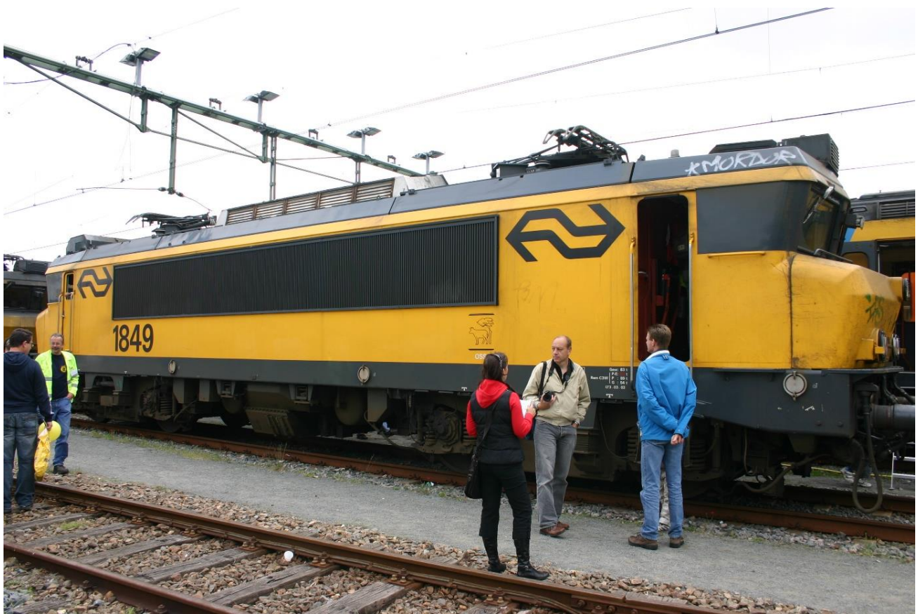
De 1849 tijdens show in Alkmaar op 16 mei 2009.

De 1600 is gebouwd door Alstom en was vanaf 1981 in gebruik. De serie werd in 1978 besteld, nadat in de jaren zeventig verschillende soorten locs bij de NS hadden proefgereden. De 1600 is afgeleid van de Franse SNCF BB 7200. Van de 1600-serie werden er 58 besteld en afgeleverd tussen 1981 en 1983. Ten gevolge van de aankoop van deze nieuwe locs konden de oude exemplaren van de series 1000 en 1500 worden afgevoerd.