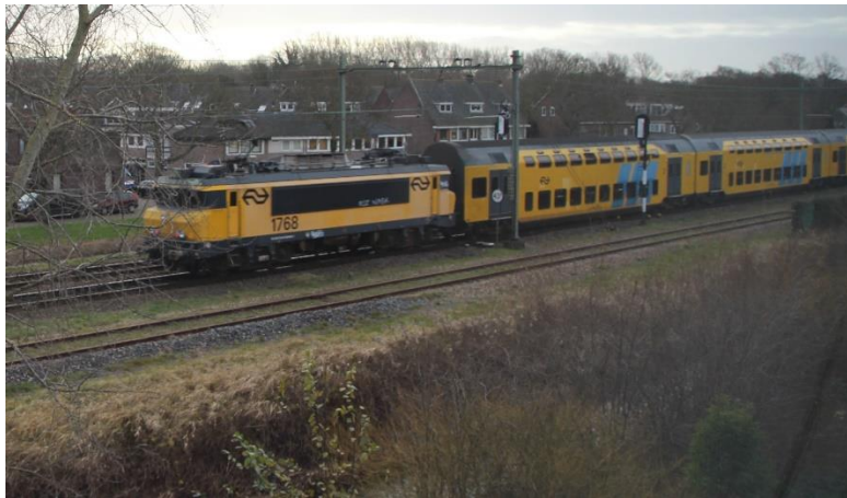
Afscheid rit DDM stel 1768.

In mijn inleiding noemde ik deze al. Deze serie werd in de jaren negentig gebouwd en als gezegd leek deze op de 1600/1800. Technisch zijn er enige verschillen. Een 1700 kan ook niet samen rijden met een 1600/1800.