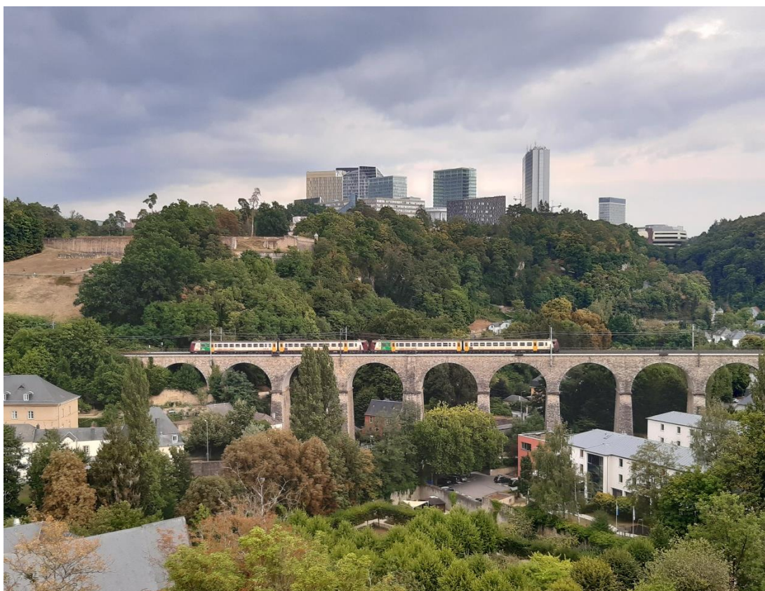
Treinverkeer in Luxemburg