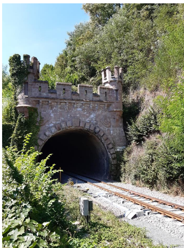
Zou het goed doen op de modelbaan, gezien in Kyllburg Eifel Duitsland