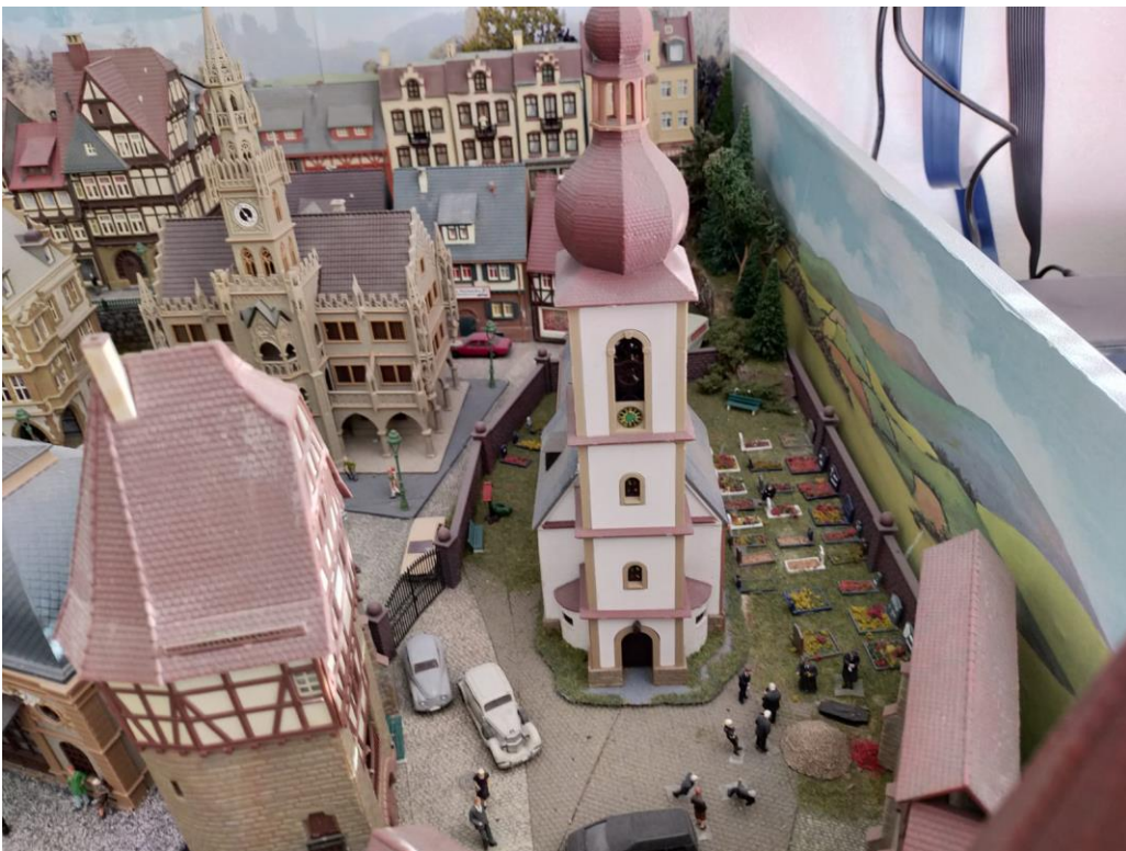
Binnenstad van Ab.