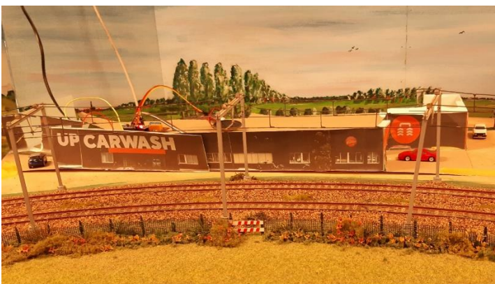
Up Carwash in aanbouw

Op vrijdag 14 april werd de wagen volgeladen met de baanstukken, die in het zaaltje opgesteld zouden worden. Het aanvankelijke plan van een iets grotere baan werd verlaten, zodat er een knus baantje neergezet kon worden in de ontvangstruimte. Er moest ook ruimte over blijven voor stoelen, tafels en rollators.