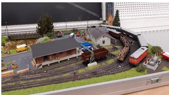
Kofferbaan van Udo