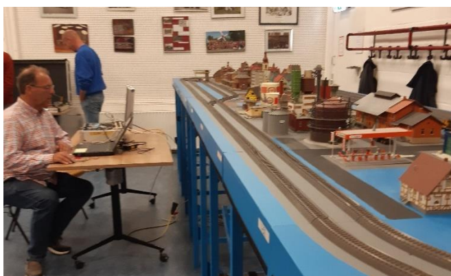
Märklinbaan in ontwikkeling