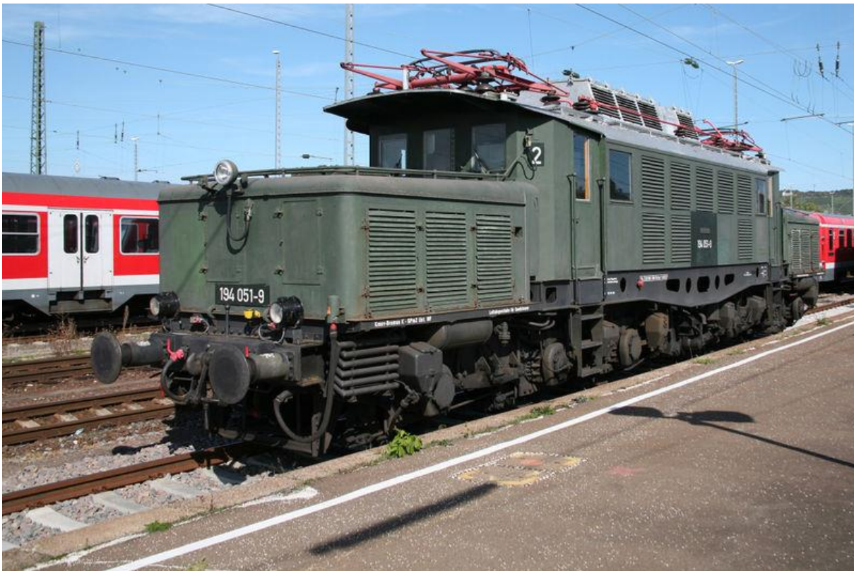
Deutsche Bundesbahn (DB) Baureihe 194.

De BR194/E94, ook wel “Duitse krokodil” genoemd werd in de periode 1940-1945 gebouwd door de firma’s AEG, SSW en Kraus-Maffei. De BR194/E94,s werden speciaal voor het zware goederenvervoer gebouwd maar werden echter ook regelmatig ingezet voor passagierstreinen. Tot 1945 werden er 146 van deze locomotieven uitgeleverd . De locomotieven haalden een topsnelheid van ongeveer 90 tot 100 km/h. (Bij het voorttrekken van 2.000 ton haalde de locomotief nog een snelheid van zo’n 85km/h). Na de 2e wereldoorlog volgde aflevering van nog enkele loc’s en werden de locomotieven van de E94 opgedeeld tussen oost en west Duitsland en Oostenrijk. De meeste locomotieven gingen naar de DB. Bij de DR waren 30 stuks in het bestand en bij de Oostenrijkse ÖBB 44 stuks. In de periode 1954-1956 werd nog een serie van 43 stuks E94 locomotieven gebouwd en afgeleverd. In de 60’er jaren werden de daken verlengd en werden de aangepaste locomotieven E194 genoemd. De reden om deze te verlengen lag in het feit dat de machinisten veel hinder van de zon ondervonden. In 1988 werd de laatste BR 194/E94 bij de DB buiten dienst genomen, in 1991 de laatste in de DDR, en in 1995 de laatste bij de ÖBB (Rh 1020). .