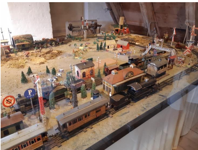
Bing Modeltreinbaan in museum in Egeskov.

In 1935 was de reistijd over land aanzienlijk korter geworden in Denemarken. De brug over de Kleine Belt werd geopend en de nieuwe express-treinen werden ingezet op de hoofdlijnen in Denemarken. De reistijd van Kopenhagen naar Aalborg werd verkort van 10 en half uur naar 6 en half uur. In 1933 ging de Deense DSB een samenwerking aan met Frichs Maskinenfabrik en Vognfabrikken Scandia om een nieuw type trein te leveren. Vier diesel-treinstellen bestaande uit twee motorwagons en een middenwagon kwamen gereed in 1935. De express-treinen werden populair en in 1938 werden nog vier treinstellen geleverd, deze keer met een extra middenwagon. Een deel van deze trein was de eerste die de Kleine Belt Brug op 14 mei 1935 passeerde. Deze treinstellen waren in gebruik tot 1973.