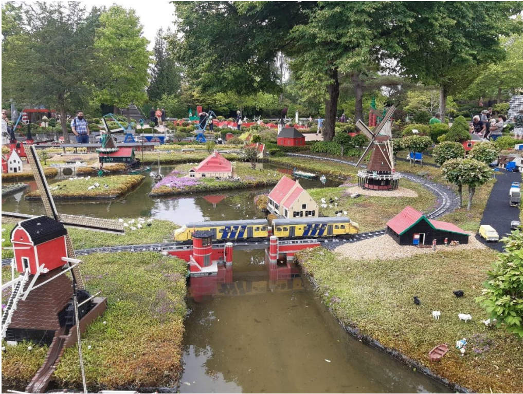
Nederlands landschap in Legoland.

Deze keer het vervolg van het treinbezoek in Denemarken. Allereerst nog een overzicht in Legoland.