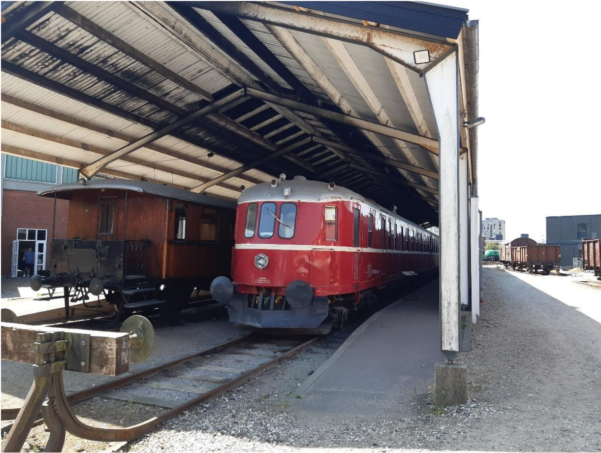
De rode Express trein MS 401-AA 341-MS 402.

In 1935 was de reistijd over land aanzienlijk korter geworden in Denemarken. De brug over de Kleine Belt werd geopend en de nieuwe express-treinen werden ingezet op de hoofdlijnen in Denemarken. De reistijd van Kopenhagen naar Aalborg werd verkort van 10 en half uur naar 6 en half uur. In 1933 ging de Deense DSB een samenwerking aan met Frichs Maskinenfabrik en Vognfabrikken Scandia om een nieuw type trein te leveren. Vier diesel-treinstellen bestaande uit twee motorwagons en een middenwagon kwamen gereed in 1935. De express-treinen werden populair en in 1938 werden nog vier treinstellen geleverd, deze keer met een extra middenwagon. Een deel van deze trein was de eerste die de Kleine Belt Brug op 14 mei 1935 passeerde. Deze treinstellen waren in gebruik tot 1973.