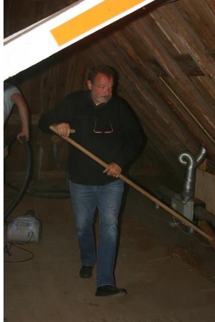
Clubavond op 14 oktober 2007