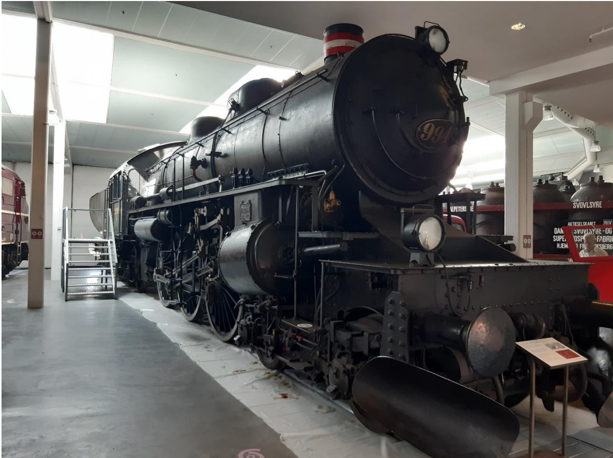
De klasse E locomotief, Zweeds-Deens, E994 in het Jernbanenmuseum