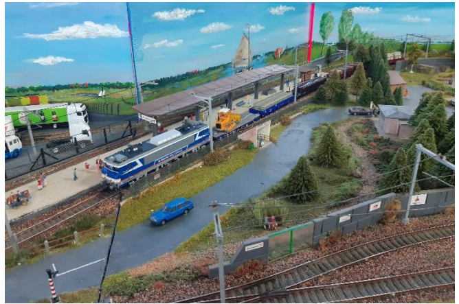
Eigen foto's, onderste foto is van Willem Blaeu